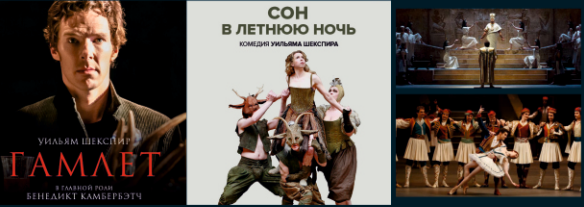
УИЛЯМ ШКЕСПИР ГАМАДЕТ ГЛАВНОЕ РОЛИ БЕНЕДИКТ КАМЕРБАТЧ

CINEMA CENTER КИНОТЕАТР с 24 сентября по 31 декабря 2019 года