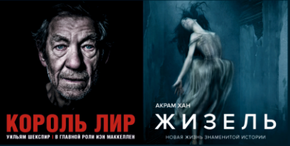
УИЛЯМ ШКЕСПИР КОРОЛЬ ЛИР УИЛЬЯМ ШКЕСПИР В ГЛАВНОЙ РОЛИ ИОН МАККЕЛЛЕН АКРАМ ХАН ЖИЗЕЛЬ НОВАЯ ЖИЗНЬ ЗНАМИТОЙ ИСТОРИИ

Бронирование билетов: 8(4112) 31-88-50 www.kino.ykt.ru www.afisha.ykt.ru