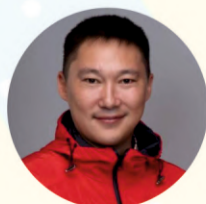
Автор: Алексей Алексеевич КЫЧКИН